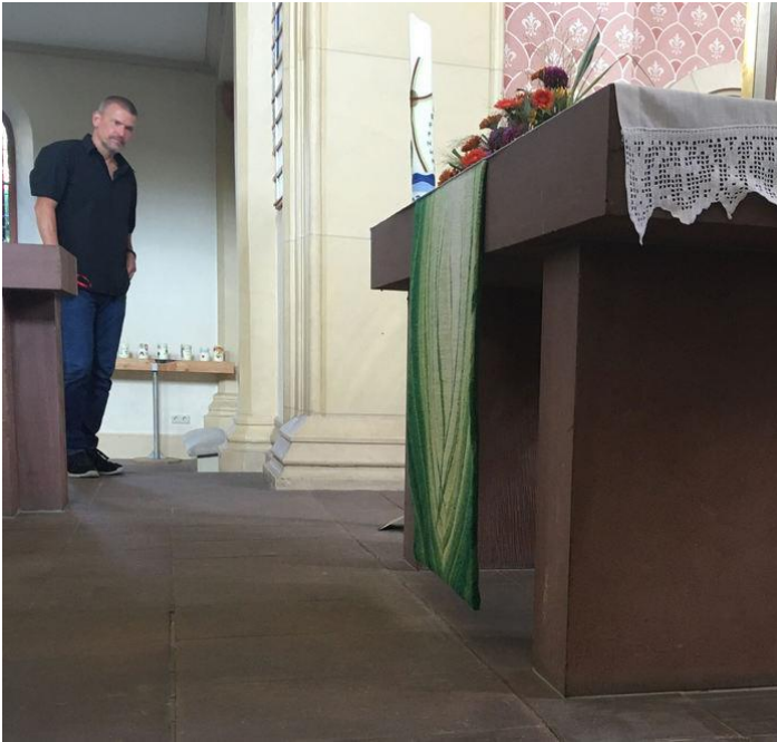
Vor dem Altar hat sich der Boden abgesenkt und muss saniert werden.